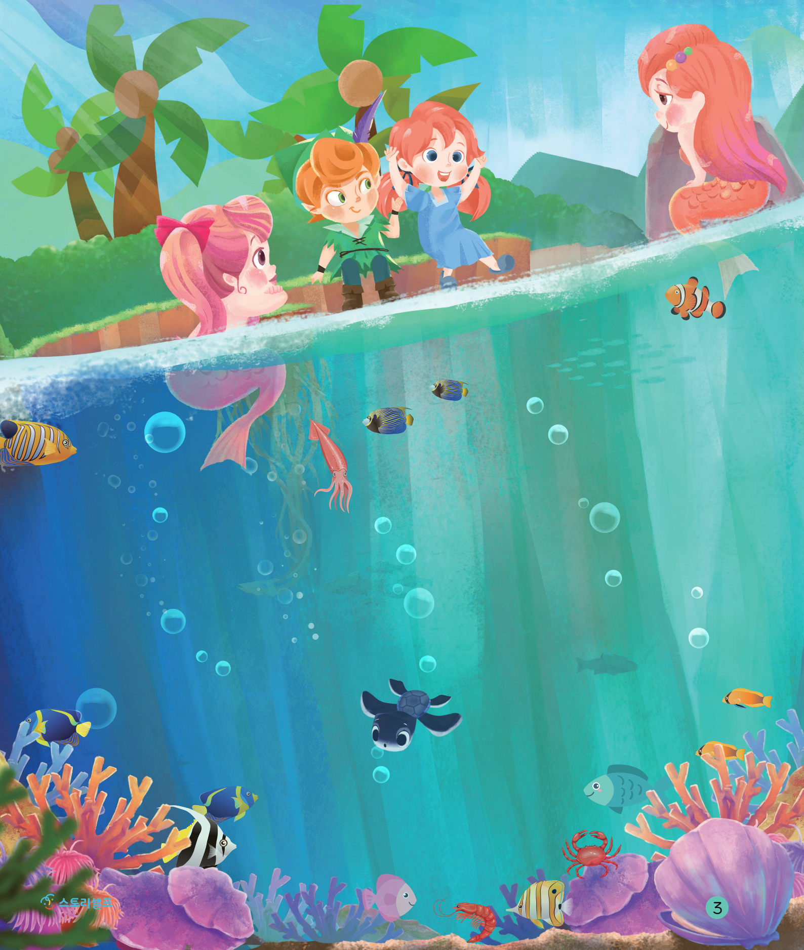
그림 속의 물고기를 모두 세어보아요.